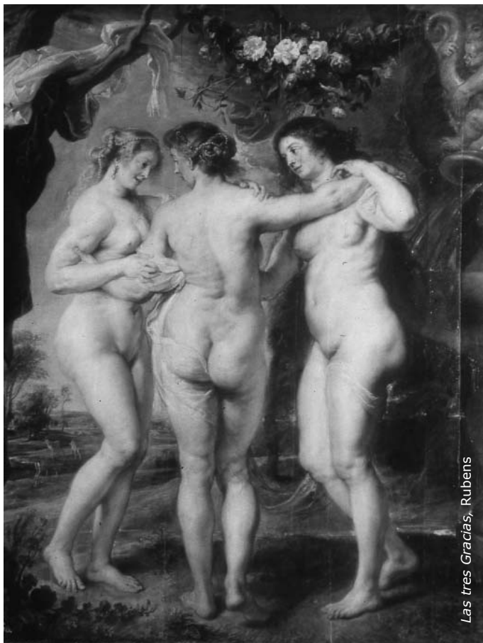
Las tres Gracias, Rubens