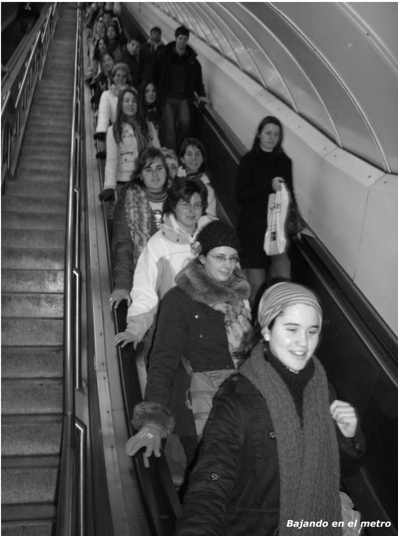
Bajando en el metro

A las 9.30 subimos al autobús para hacer una visita panorámica con una guía muy peculiar a la hora de formar oraciones y quedarse pensado (..y sin embargo lo hizo muy bien!!!)