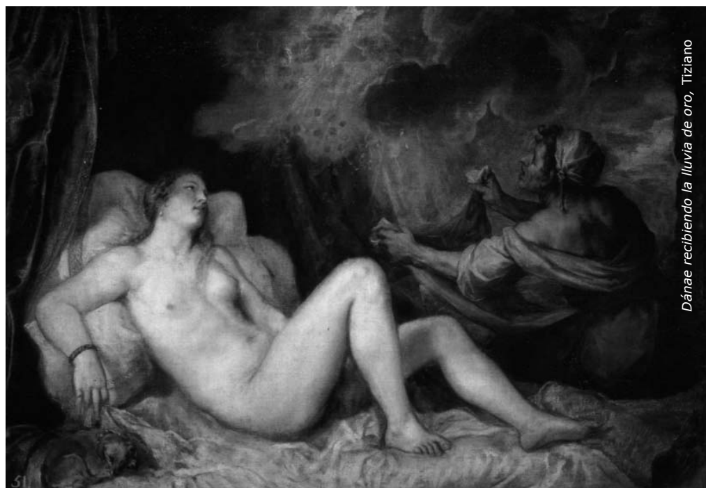
Dánae recibiendo la lluvia de oro, Tiziano

◆ Dánae recibiendo la lluvia de oro: el mito cuenta que Dánae fue