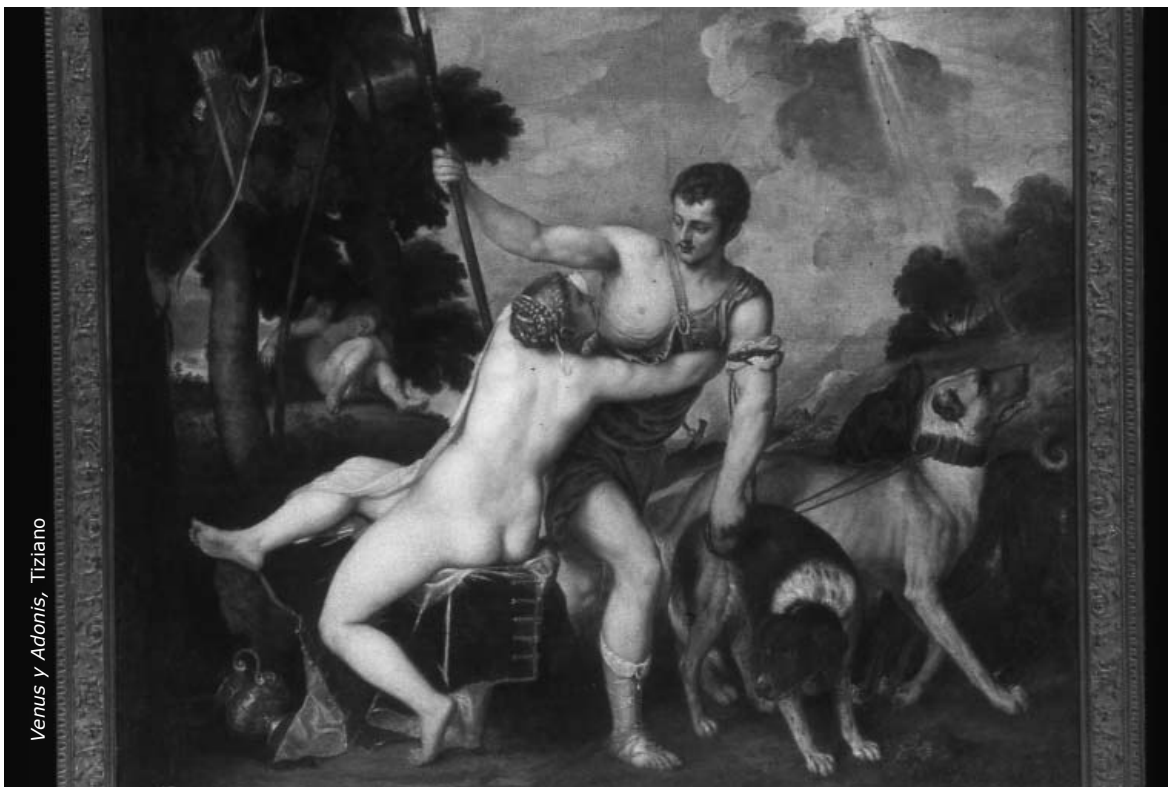
Venus y Adonis, Tiziano

encerrada en una torre por su padre el rey, ya que una profecía decía que un descendiente le quitaría el trono. Pero Zeus se enamoró de Dánae y bajó en forma de lluvia de oro.