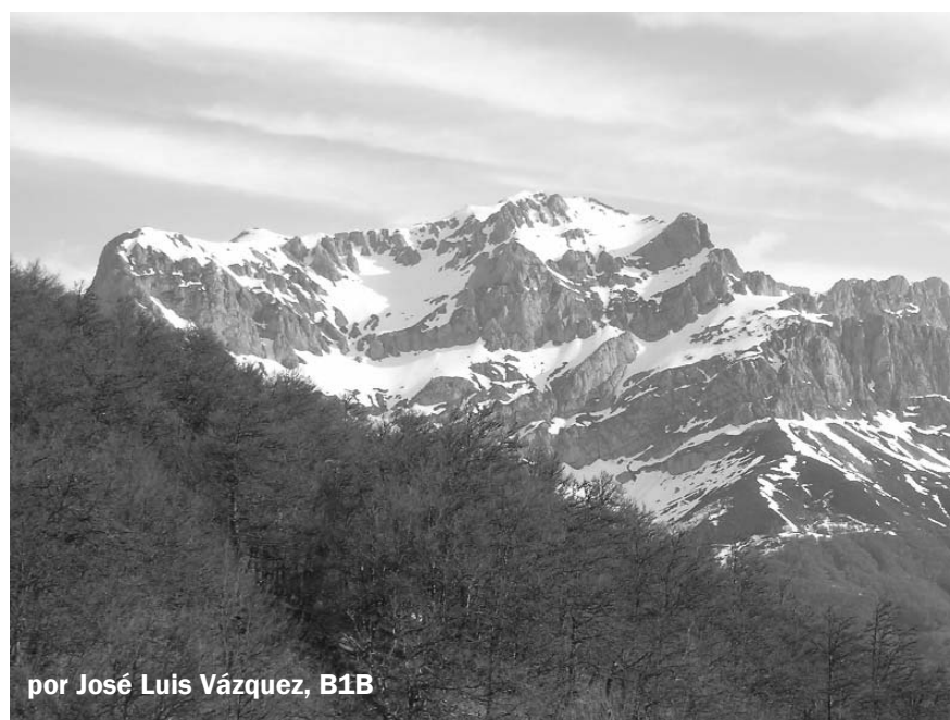
por José Luis Vázquez, B1B