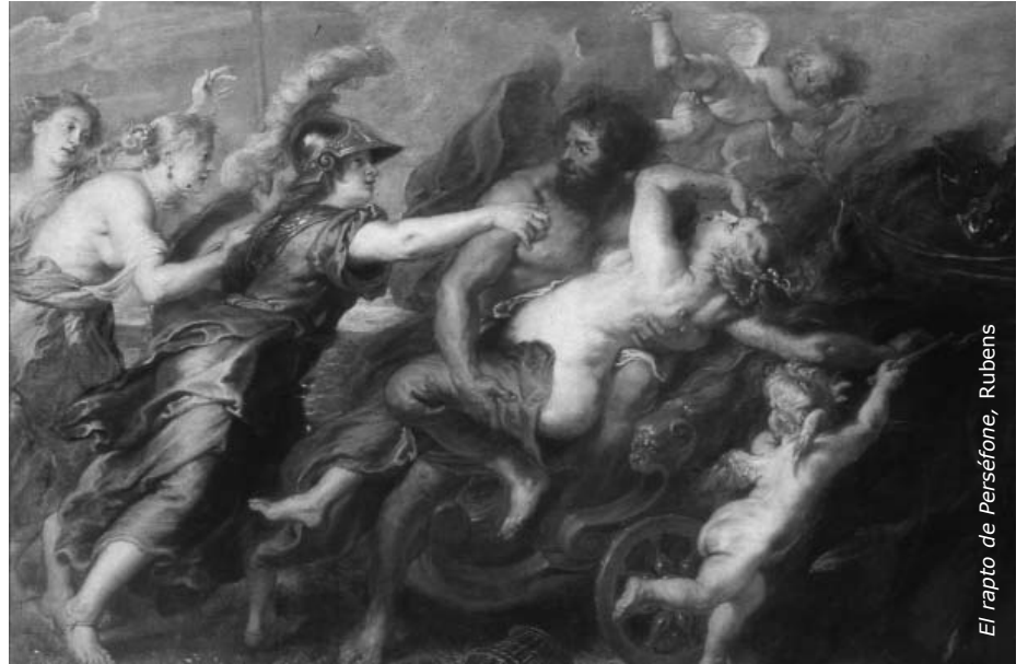
El rapto de Perséfone, Rubens

◆ Orfeo y Eurídice: Orfeo estaba casado con Eurídice, pero ésta muere y él baja a buscarla al Hades. En el cuadro se ve cómo Orfeo se lleva a Eurídice (con la condición de que no puede verla hasta que salgan de allí) y a Proserpina con su esposo Plutón,