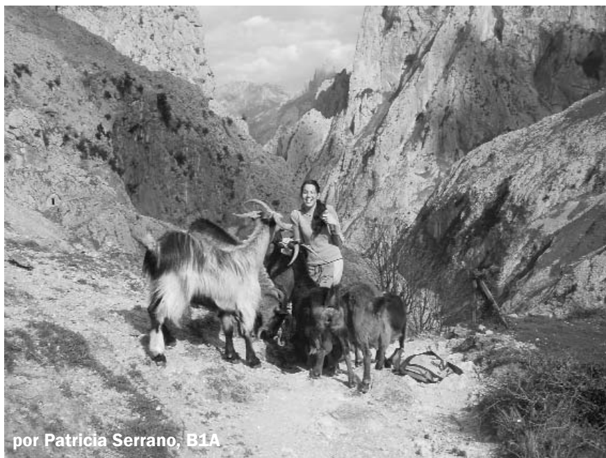
por Patricia Serrano, B1A