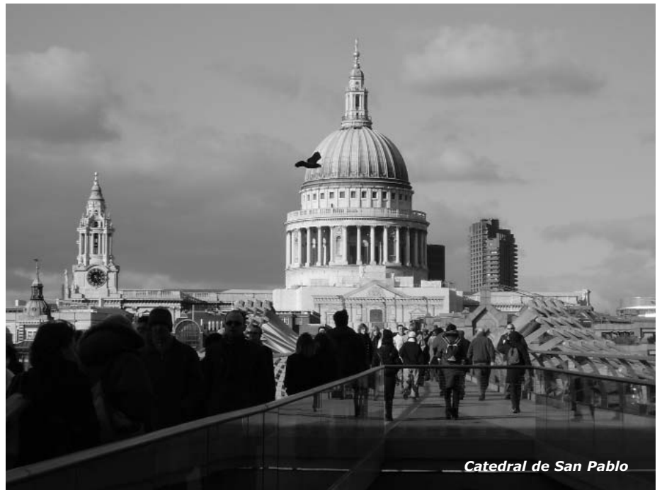
Catedral de San Pablo

Al terminar la visita de los museos fuimos a Harrods y pasamos allí una hora alucinando con los disparatados precios de la moda inglesa