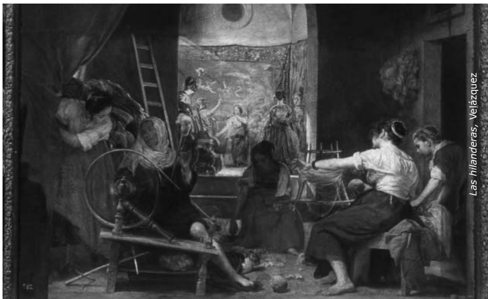
Las hilanderas, Velázquez

◆ Las hilanderas: en primer plano se ve tejer a unas hilanderas, pero al fondo se ve la historia del mito de Aracne, una hilandera que tejía tan bien que se atrevió a desafiar a Atenea. Las dos tejieron un tapiz y Aracne tuvo la osadía de tejer la escena del rapto de Europa. Atenea se enfadó tanto que convirtió a Aracne en una araña; de ese modo estaría condenada a tejer toda la eternidad.