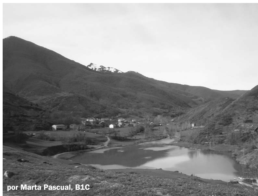
por Marta Pascual, B1C