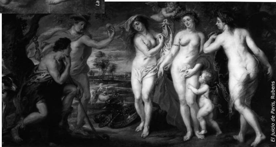
El Juicio de París, Rubens