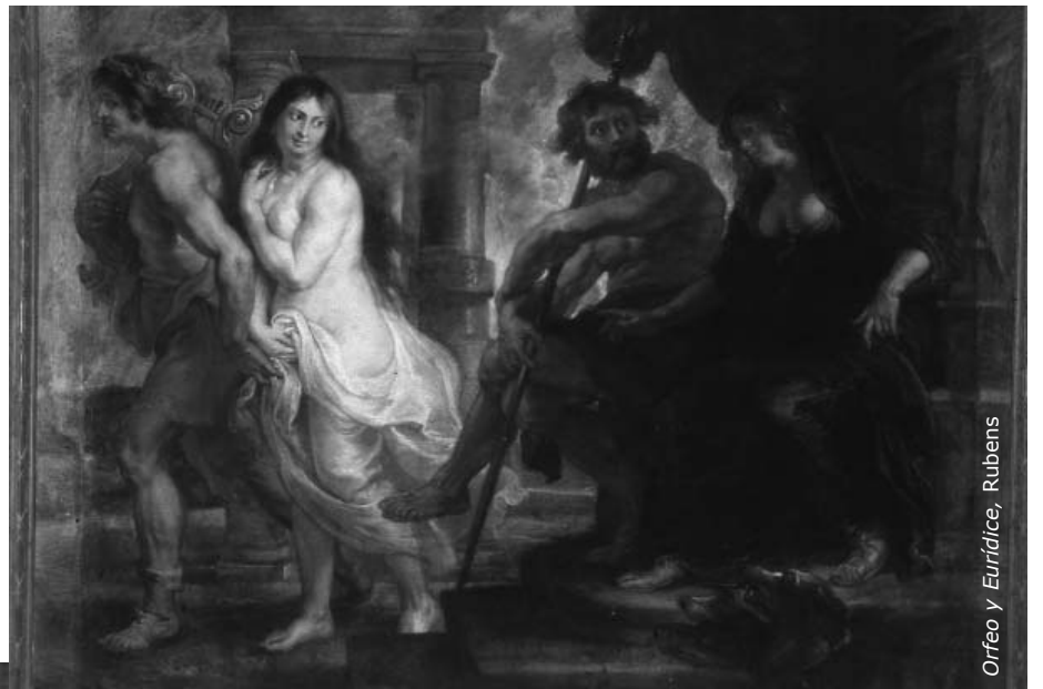
Orfeo y Eurídice, Rubens