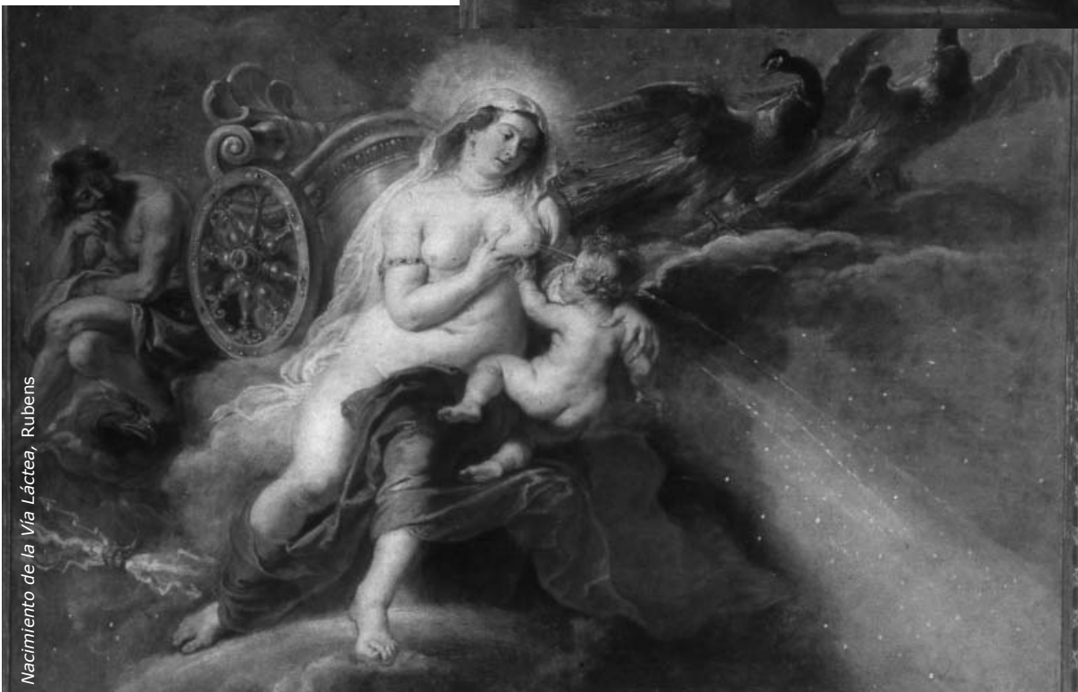
Nacimiento de la Vía Láctea, Rubens