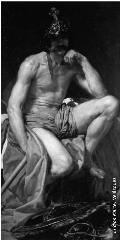
El dios Marte, Velázquez

◆ El triunfo de Baco: en este cuadro se ve una de las fiestas del dios Baco, dios del vino y la fiesta.